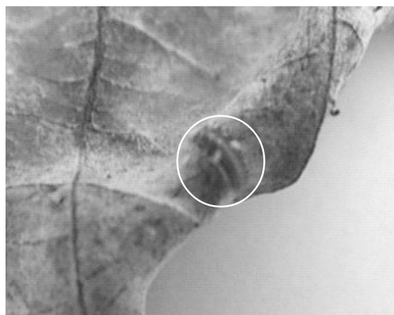
Figura 2. Larva de P. nana alimentándose de mildiu sobre hoja de bija.

En Cuba existen referencias anteriores sobre la presencia de larvas y adultos de P. nana alimentándose de mildiu en frijol [Cruz et al. , 1990] y en girasol [Cruz et al. , 1989]; sin embargo, su asociación a Oidium spp. en plantas medicinales y aromáticas no se ha documentado con anterioridad, por lo que se consideran nuevos registros su asociación sobre este patógeno en los culti-