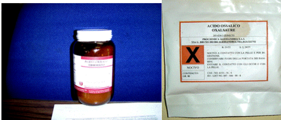
Fig. 1. Ácido oxálico calidad reactivo. Fig. 2. Saquillo de ácido oxálico.

este fin y envasado en saquillos plásticos de 80 g (Fig. 2), producido por la empresa italiana Prochimia Alessandria S.A.S.