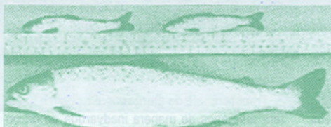
Este salmón del Atlántico transgénico, medido en comparación con los utilizados como testigo, muestra las posibilidades de la biotecnología para aumentar el suministro de alimentos.

La obtención de cultivos resistentes a los insectos es un ejemplo del segundo. Los científicos obtienen cultivos modificados genéticamente , como algodón y maíz, mediante la introducción de un gen de una bacteria. Las nuevas variedades producen una toxina letal para los insectos, reduciendo así la necesidad de plaguicidas.