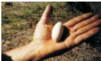
Fig. 3. Endocarpio de una semilla de mamey o sapote después de rota la testa.

Las semillas germinarán a partir de los 15 días. Cuando las plantas tengan una altura de 15 a 20 cm estarán listas para trasplantar de los canteros a las bolsas.