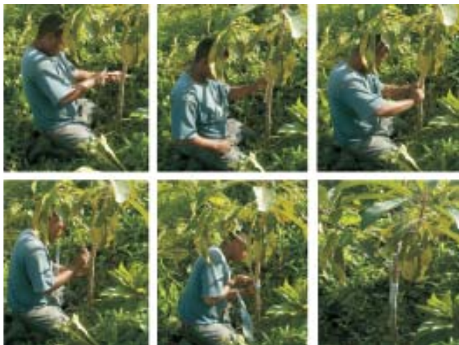
Fig. 5. Injerto tangencial del mamey colorado o sapote

afectando algo el cambium pero sin llegar nunca al leño. Una vez preparado el patrón para recibir el injerto se toma la yema elegida de acuerdo al diámetro de este y con un largo entre 8 y 10 cm. Se practica un corte a bisel en ella de un largo entre 6 y 8 cm, se coloca la cara de la yema sobre la cara del patrón y se procede a vendar ambas partes de abajo hacia arriba con una cinta de polietileno transparente, cubriéndose todos los