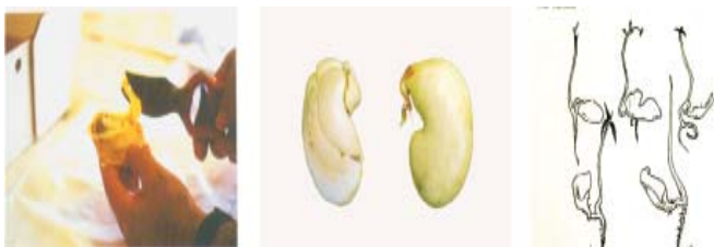
Fig. 1. Tratamiento mecánico a las semillas de mango

Se recomienda utilizar semillas poliembriónicas para garantizar plantas homogéneas. Por cada postura a obtener se colocan 2-4 semillas, éstas comenzarán a germinar a partir de los 15 o 30 días pudiendo demorar hasta 50 o 55 días. Cuando el tallo alcance una altura entre 10 y 15 cm, con las hojas de color bronceado, las plantas serán extraídas y llevadas al envase, desechando las que no estén vigorosas o estén deformadas. Hay que tener mucho cuidado en no estropear el tallo ni las raíces. Si el arranque de la planta demorara, habrá entonces que podar las partes de las hojas y el extremo sobresaliente de la raíz. En ambos casos se acomodarán en cajas por tamaño y se colocarán a la sombra por no más de 72 horas.