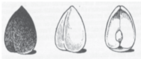
Fig. 2. Colocación de semillas de aguacate

de los cultivares seleccionados para patrones. Las semillas se extraen utilizando cuchillos de poco filo, o se aprietan cuidadosamente con las manos para no quitar la cubierta fina que las cubre. Luego se lavan y se ponen a secar a la sombra. Deben desecharse las semillas que sean alargadas y coniformes. Las semillas se guardarán en cajas de madera o plásticas. Se deben poner a germinar antes de los 10 días para evitar demoras que disminuyan el poder germinativo de las mismas.