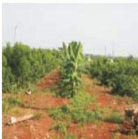
Asociación aguacate-guayaba en hilera y plátano en las calle