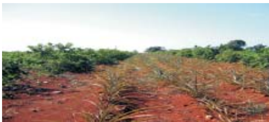
Asociación de aguacate-guayaba en la hilera y piña en las calles