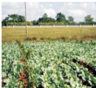
Asociación aguacate hilera y hortalizas calle